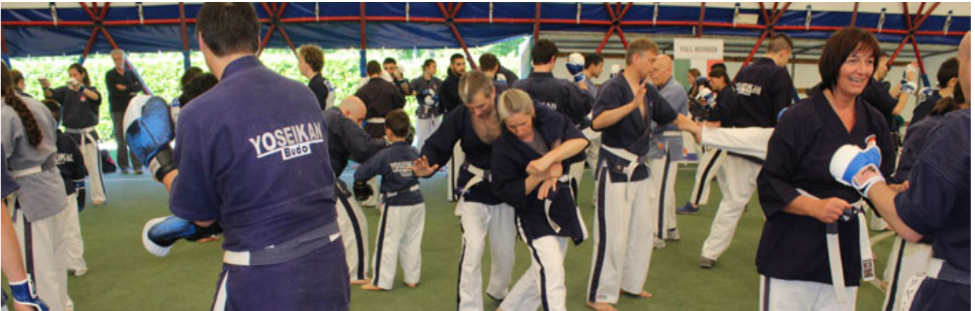
Das große Südtiroler Yoseikan-Treffen mit vielen Freunden