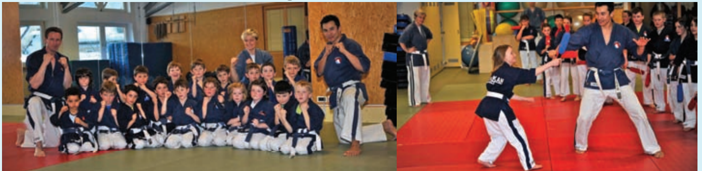
Trainingsgruppe Kinder in Niederdorf