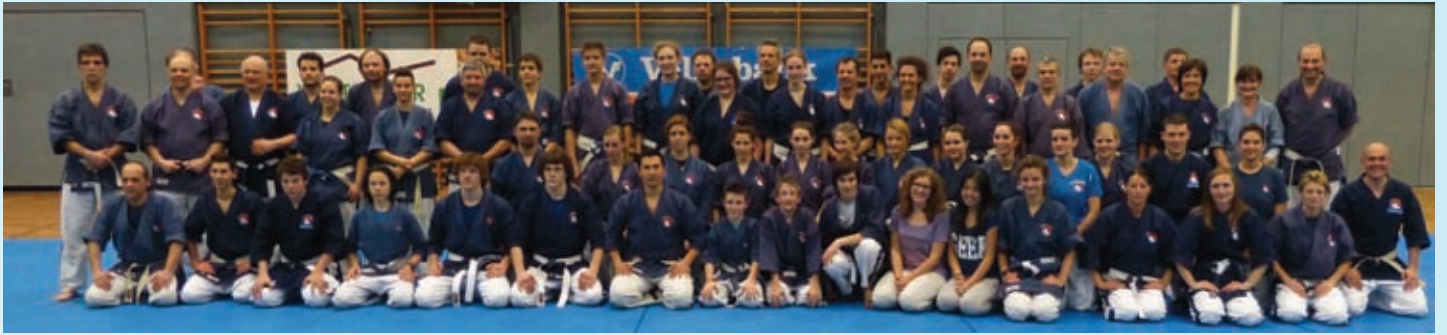
Landesstage in Meran