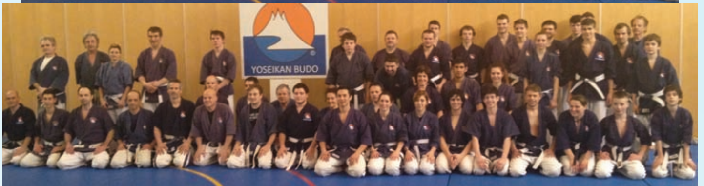
Trainingsgruppe in Nals