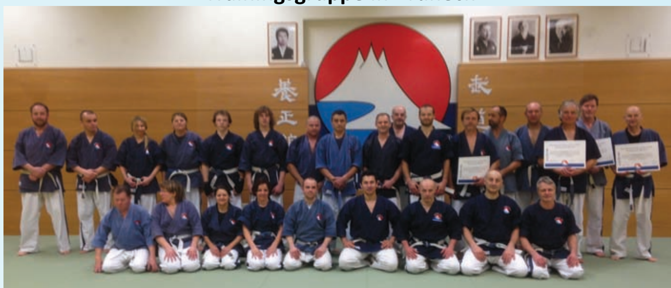
Dan-Träger und Aikido Mochizuki-Gruppe in Bruneck