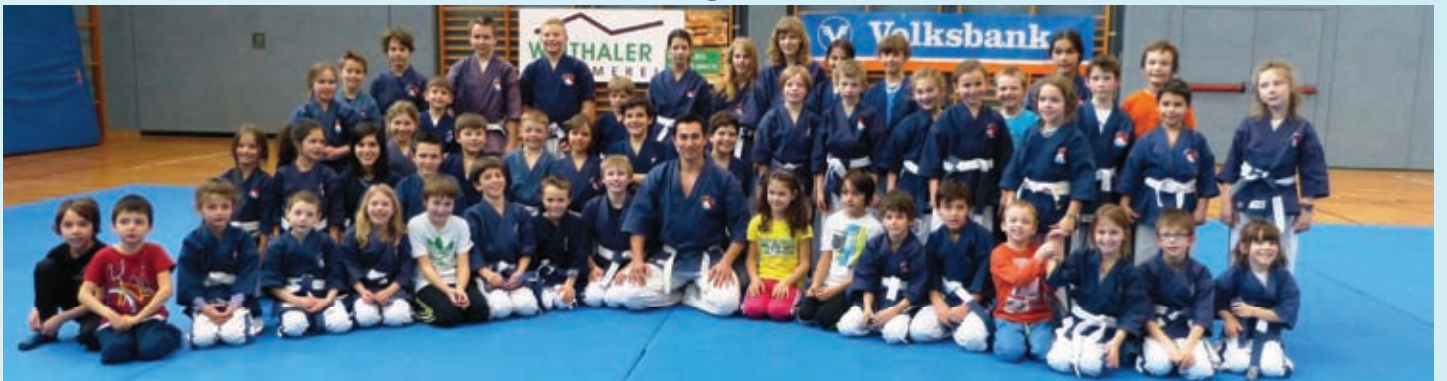
Landesstage der Kinder in Meran